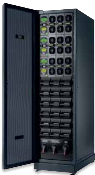
3 103 61