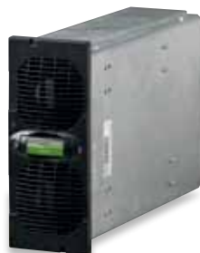
3 104 73