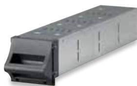
3 108 55