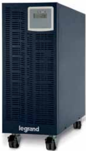
3 101 20