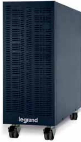
3 107 41